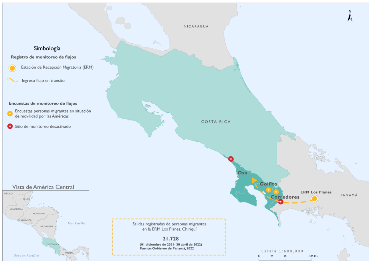
Mapa 1. Flujos de personas migrantes irregulares en Costa Rica

El siguiente reporte resume los principales hallazgos del trabajo realizado entre el 01 y el 30 de abril de 2022.