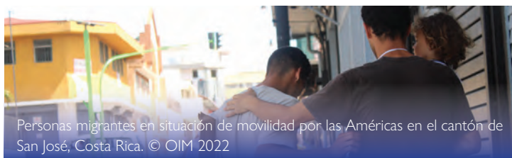
Personas migrantes en situación de movilidad por las Américas en el cantón de San José, Costa Rica.

Nota: Se considera el flujo que registró su salida de la ERM Los Planes. Para julio, debido a los bloqueos de carretera en Panamá, las personas no estaban llegando hasta la ERM Los Planes, por lo que las entradas a Costa Rica, durante este mes, están subrepresentadas