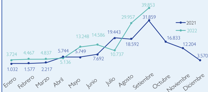
Gráfico 1. Salidas de la Estación de Recepción Migratoria (ERM) de Los Planes, Gualaca