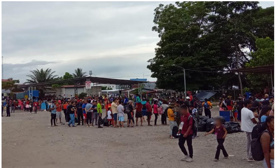
Personas migrantes esperando autobús hacia la frontera norte de Costa Rica Paso Canoas, Corredores, Puntarenas, Costa Rica

En conclusión, Costa Rica juega un papel de vital importancia en el complejo flujo migratorio que atraviesa las Américas, y se encuentra frente a desafíos financieros significativos en relación con las personas que se desplazan. El informe resalta la profunda dependencia en las remesas como fuente crucial de sustento en medio de rutas migratorias llenas de obstáculos. Este fenómeno es particularmente evidente en las zonas fronterizas y durante el tránsito por el Gran Área Metropolitana (GAM). Los altos costos asociados y los riesgos inherentes a la utilización de intermediarios resaltan como barreras importantes en este contexto. Las remesas emergen como un pilar económico fundamental, aliviando las dificultades y brindando la capacidad de encarar los retos en un viaje incierto pero esencial para el bienestar de los migrantes en movimiento.