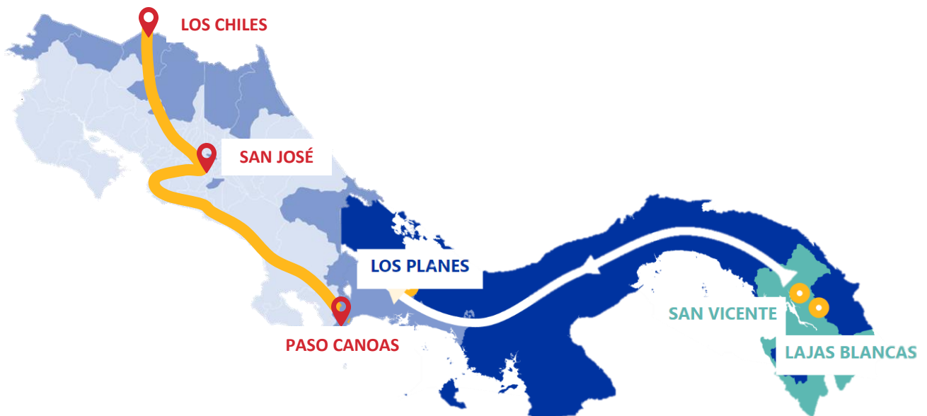
Mapa 1. Ruta migratoria principal del trayecto Panamá y Costa Rica.

Nota: El presente mapa es únicamente para fines ilustrativos. Los límites, nombres y designaciones utilizadas, no implican respaldo o aceptación oficial por parte de la OIM.